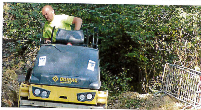
■ La partie endommagée de la chaussée a été réhabilitée.

Du hameau de la Favède, on aperçoit au loin, à travers de la forêt de châtaigniers et de pins, les mas du secteur de Ruffières, à trois kilomètres. Pour y accéder, direction le château, par la petite départementale qui s'infiltrera plus résolument après plusieurs tronçons très pentus, dans la pinède. C'est à quelques encablures des premières habitations, juste après avoir fran-