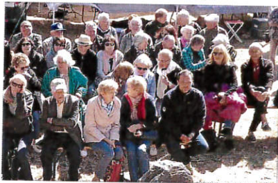
■ Une partie de l'assistance lors de la conférence.